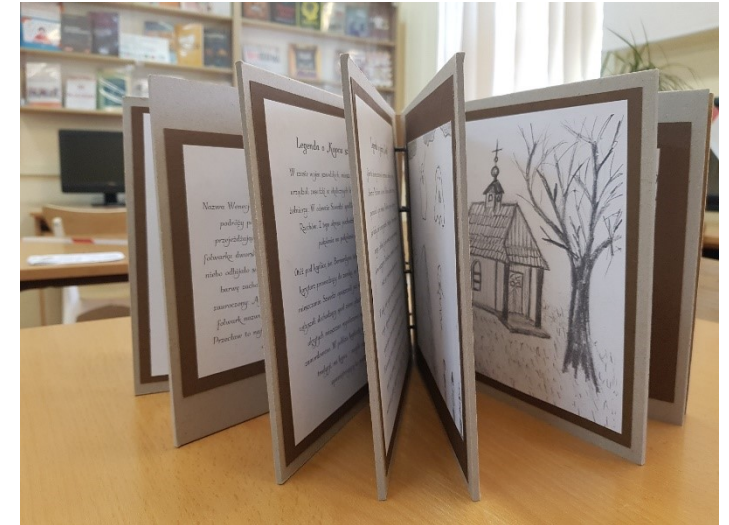
Zadanie 2. dodatkowe – książka artystyczna, SP w Przecławiu