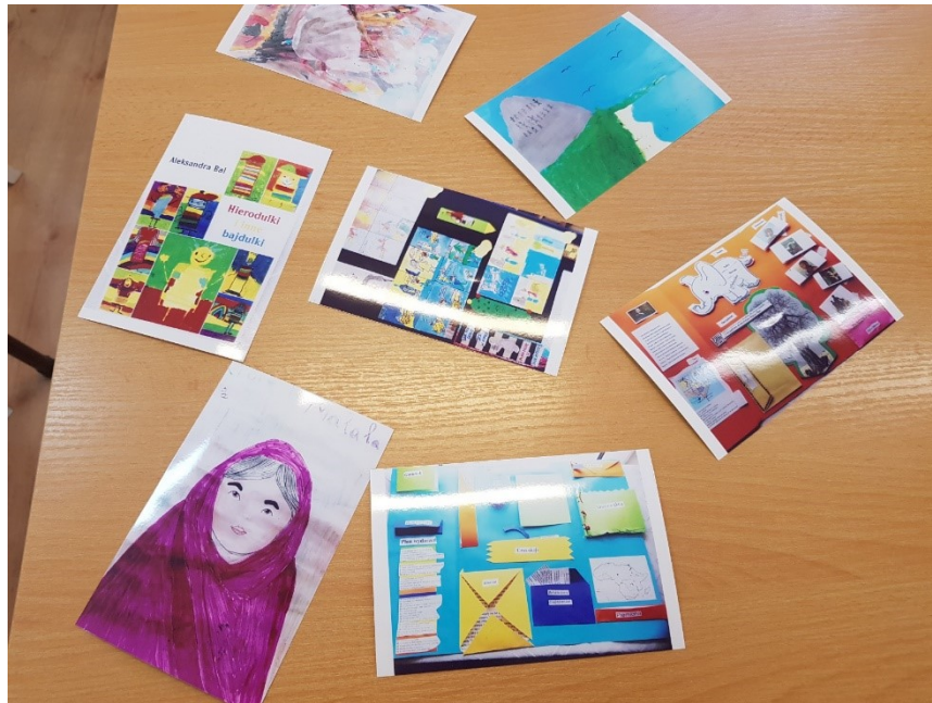
Zadanie dodatkowe – konkurs plastyczny, SP w Gnojnicy Woli