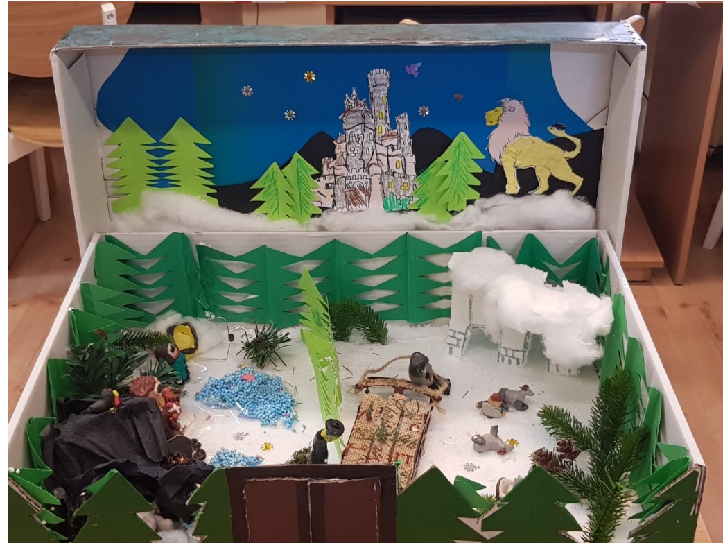
Zadanie 2. dodatkowe – książka artystyczna, SP nr 28 w Rzeszowie